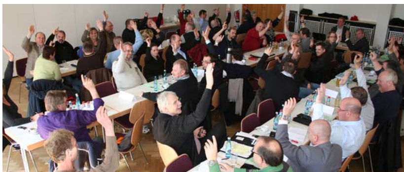
Einstimmigkeit: Tarifkommissionsmitglieder im Kfz-Handwerk

Überdurchschnittlich hoch ist die Tarifbindung bei Finanz- und Versicherungsdienstleistern und im Baugewerbe. Besonders niedrig ist sie bei Unternehmen der Informations- und Kommunikationsbranche. Die Tarifbindung steigt mit der Betriebsgröße: Betriebe im Branchentarifvertrag sind mehrheitlich Großbetriebe mit über 500 Beschäftigten.