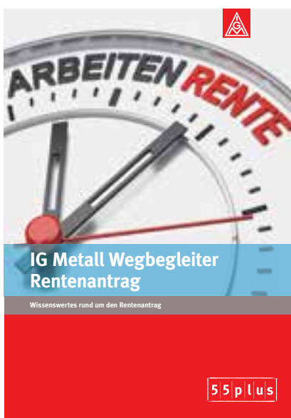
Broschüre DIN A4, Produkt-Nr. 29029-67804

Rechtzeitig vorsorgen schafft Sicherheit. Der Wegbegleiter bietet Organisationshilfe und kann die Basis eines persönlichen Vorsorgeordners sein, in dem alle wichtigen Dokumente zur Vorsorge abgelegt sind. Er umfasst die Themen Finanzen, Versicherungen, Mitgliedschaften sowie Patientenverfügung und Vorsorgevollmacht.