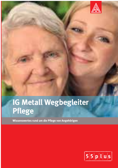
Broschüre DIN A4, Produkt-Nr. 37289-67644