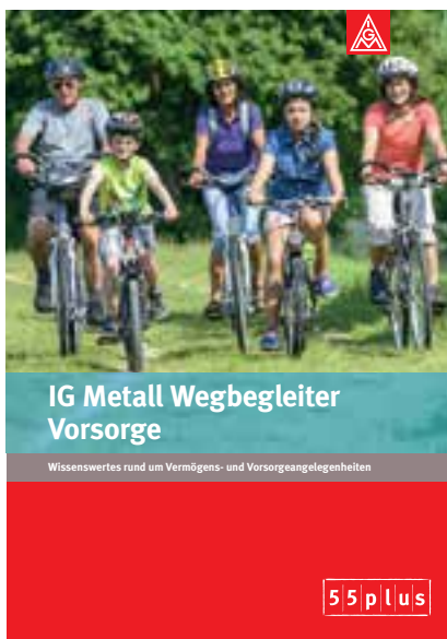
Broschüre DIN A4, Produkt-Nr. 27626-67784

Die IG Metall engagiert sich für sichere Arbeitsplätze, faire Löhne sowie eine gute soziale Absicherung. Sie unterstützt ihre Mitglieder bei Problemen in der Arbeitswelt aber auch bei weitergehenden Fragen des Lebens. In der Wegbegleiter-Reihe werden Lebens- und Alltagsfragen wie Vorsorge, Rente, Gesundheit, Pflege aufgegriffen. Die Themen werden übersichtlich aufgearbeitet und Orientierungshilfen gegeben.