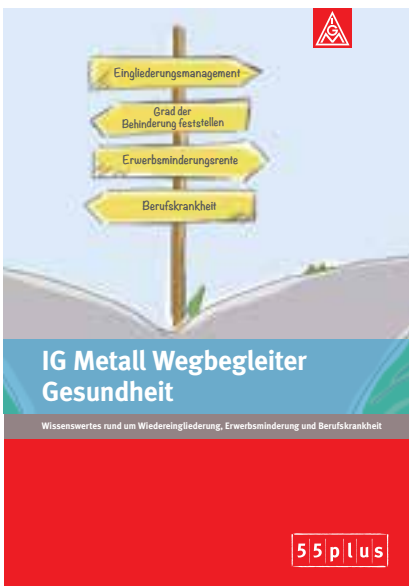
Broschüre DIN A4, Produkt-Nr. 40369-75284

Die zentralen Fragen rund um das Thema Pflege von Angehörigen werden im Wegbegleiter Pflege beantwortet. Er wird durch acht vertiefende Bausteine ergänzt: Teilzeit für Pflegenden, Antragstellung und Begutachtung, Pflegebedürftigkeit, Pflegegeld, Kurzzeit- und Tagespflege, Entlastungsbetrag, soziale Absicherung für Pflegenden, stationäre Pflege.